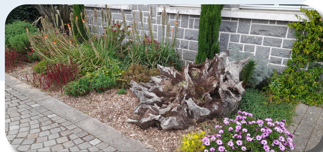
Banquette remplacée par un massif