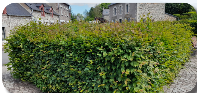
Banquette d'une largeur de 4m

Les services techniques ont commencé par supprimer ou réduire la surface et la hauteur des banquettes. La commune est ainsi passée d'une surface de banquette de 210 à 62 m 2 . Ils ont en parallèle réduit la hauteur de toutes les haies. Les plantes arrachées ont été systématiquement replantées et conduites librement.