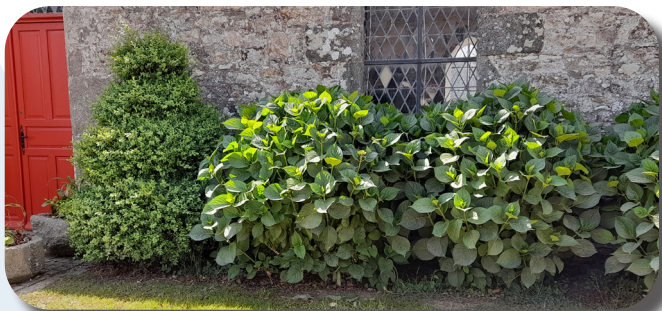
Église à l'origine, entourée d'hortensia

Les services techniques ont modifié la structure de certains massifs arbustifs pour leur donner un aspect plus diversifié et plus contemporain. Certaines plantes telles que des ifs ou des buis ont été conservés, ils ont été taillés en « nuage » ou en « topiaire spirale ». Certains arbustes ont été arrachés, d'autres ont été rabattus, des vivaces ont été incorporées pour apporter un fleurissement estival.